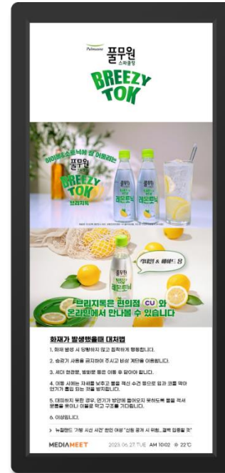
[ 브랜드 / 기존 ]