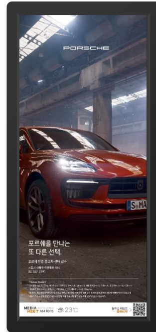
[ 브랜드 / Full Screen ]

공지 영역 (1,080 X 120) ----- 날씨, 시간, 상시 이벤트 QR